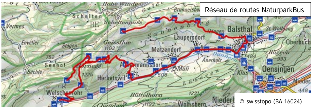
Réseau de routes NaturparkBus